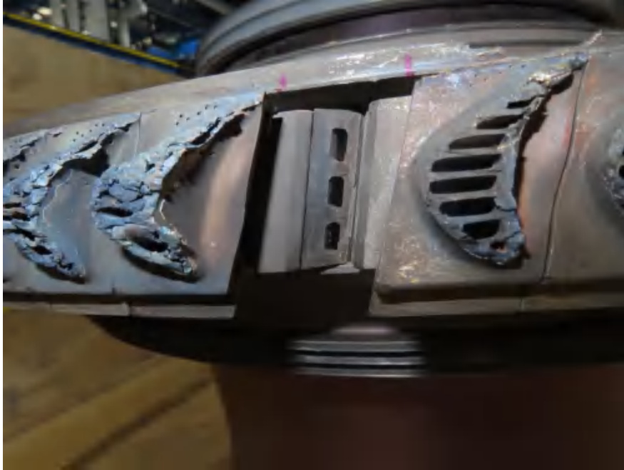
658561 断裂高压涡轮叶片进厂状态