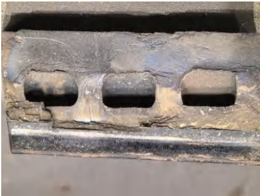
658561 断裂高压涡轮叶片的断口形貌