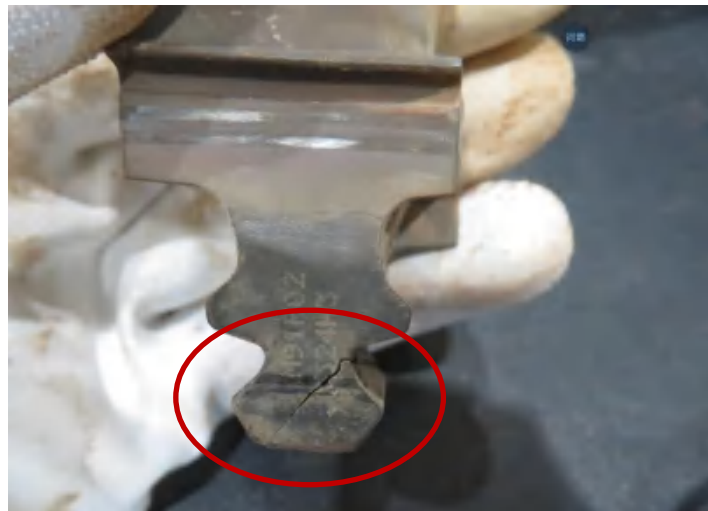
榫头小颈裂纹向下扩展