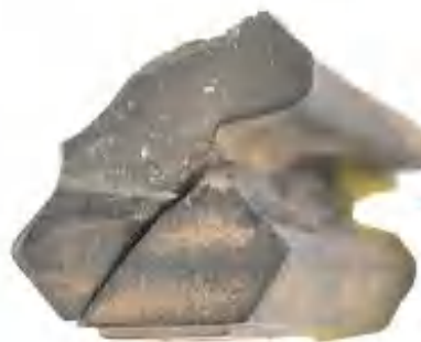
向下扩展后上压力面应力集中断裂