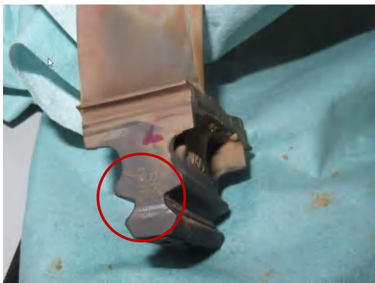
榫头小颈裂纹向上扩展

1、 高压涡轮叶片榫头小颈裂纹萌生于叶片背面，属于低周疲劳裂纹，高温与高负载是低周裂纹的萌生的主要促成因素：少数情况下小颈裂纹向上扩展导致叶片快速断裂飞出；大部分情况下小颈裂纹向下扩展不会直接导致事件，但进一步将加剧上压力面应力集中产生裂纹失效。